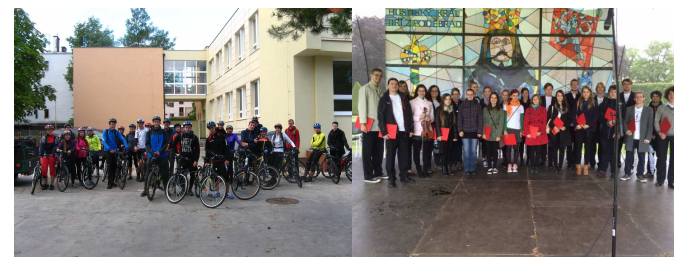
Sportovně turistický kurz