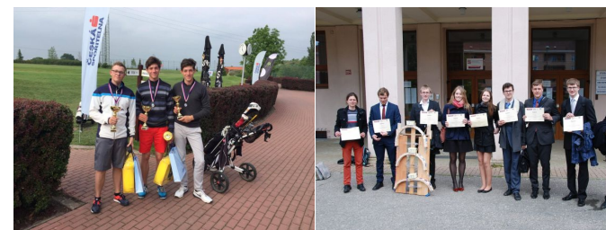
Středoškolský golfový pohár