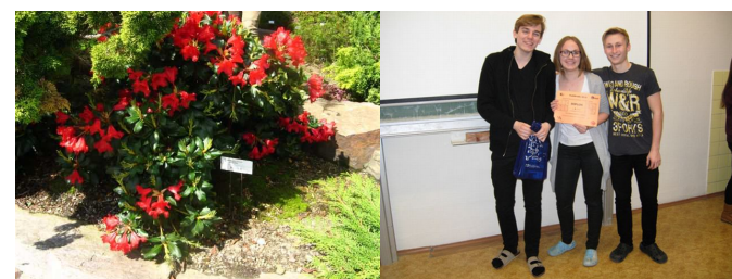
Exkurze do liberecké botanické zahrady