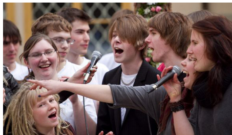
Loučeň, nádvoří zámku, projekt EU 2009-2011 se švédskými hudebníky, 2009