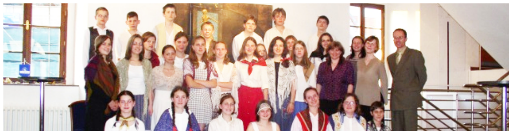
Poděbrady, divadlo Na Kovárně, premiéra Královniček Leoše Janáčka, 2004

Vánoční koncert pro veřejnost Kostel Církve husitské, Poděbrady, prosinec 2004