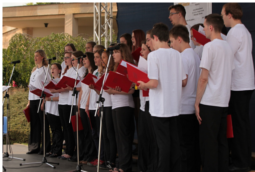
Lidice, Památník Lidice, festival pěveckých sborů ČR, 2013