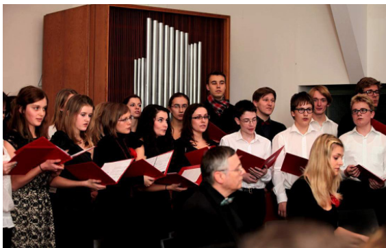
kostel Českobratrské církve evangelické Poděbrady, benefiční koncert pro Diakonii, 2014

Každý rok od 2000 do 2015 jsme věnovali výtěžek z charitativních koncertů v evangelickém kostele v Poděbradech seniorům v Diakonii ČCE Libice nad Cidlinou . Koncertovali jsme pro seniory nejen přímo v prostorách Diakonie v Libici nad Cidlinou (2009) ale také v domově pro seniory Luxor v Poděbradech (2004, 2011).