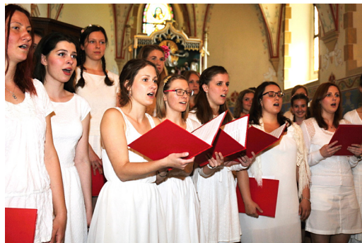
Poděbrady, Havířský kostelík, křest CD Láska notovaná, 2016