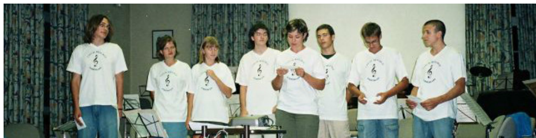
Lucembursko, Ettelbruck, projekt EU Socrates (nyní Erasmus plus), 2006

Vánoční koncert v Zámecké kapli, na pozvání PS Gymnázia Brandýs n. Labem Zámecká kaple, Brandýs nad Labem, prosinec 2006