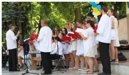
Slovensko, Piešťany, zahájení lázeňské sezóny, reprezentace města Poděbrady, 2016