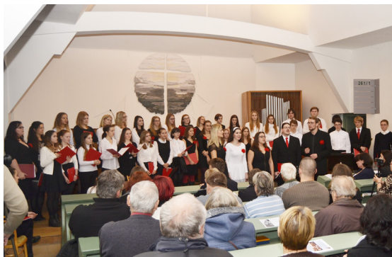
kostel Českobratrské církve evangelické Poděbrady, benefiční koncert pro Gloriet, 2016

Pro děti z Mateřské školy ve Studentské ulici v Poděbradech jsme uspořádali interaktivní koncert plný veselých písniček (1998). V roce 1999 jsme organizovali a zrealizovali koncert v evangelickém kostele v Nymburce pro děti z Dětského domova Nymburk . Koncertovali jsme pro žáky a se žáky Základní školy v Městci Králové (2009).