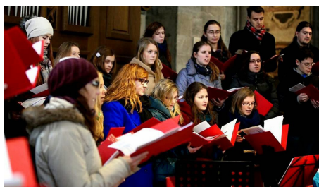
Rakousko, Vídeň, koncertní cesta ve spolupráci se spolky českých krajanů 2013, 2014, 2015