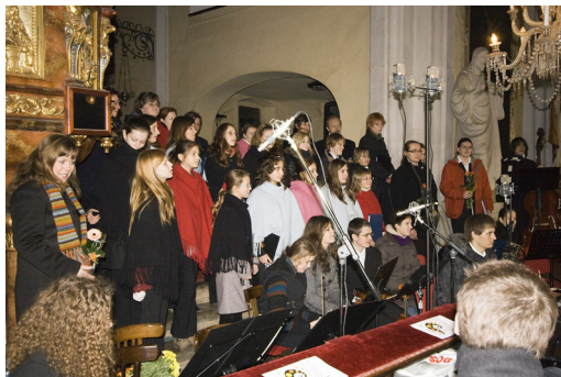
Poděbrady, kostel Povýšení sv. Kříže, premiérové uvedení Rybovy České mše vánoční "Hej, mistře!", natočeno na našem prvním DVD, 2008

Co sa stalo, přihodilo moravská vánoční koleda, arr. A. Tučapský