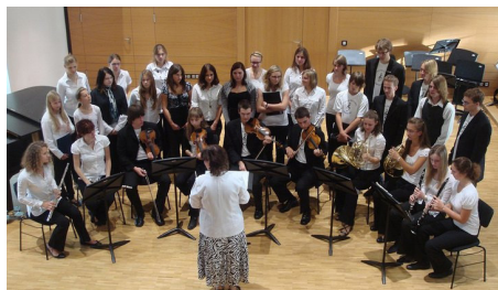
SRN, Sasko, zámek Colditz, spolupráce s pěveckým sborem ze Saska, 2010