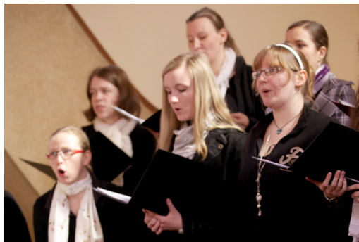
Čelákovice, kostel Českobratrské církve evangelické, benefiční koncert ve spolupráci s pěveckým sborem Gymnázia Brandýs nad Labem, 2011