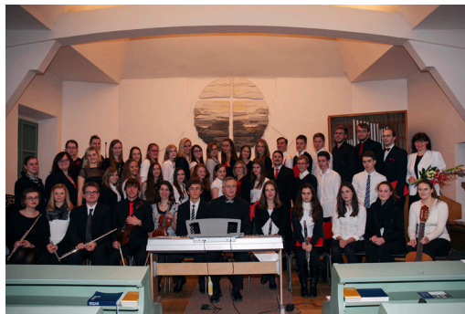
Poděbrady, kostel Českobratrské církve evangelické, benefiční koncert ve prospěch Diakonie, 2015