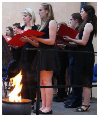
Zámecké nádvoří, Vzpomínka na poděbradské oběti holocaustu, 2017

Přispěli jsme k oslavám 70 let života v míru v rámci kulturních akcí v Poděbradech v roce 2015 a v Poděbradech jsme se účastnili programu v rámci oslav 550. výročí mírových misí Jiřího z Poděbrad . Podíleli jsme se na kulturním programu u příležitosti 500. výročí Havířského kostelíku (2016). U příležitosti Vzpomínky na poděbradské oběti holocaustu jsme na 2. nádvoří poděbradského zámku uvedli hebrejské skadby a zavzpomínali na poděbradské občany, kteří padli za obětí.