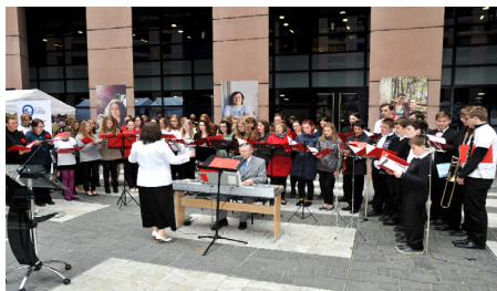
Francie, Štrasburk, atrium Evropského parlamentu, reprezentace města Poděbrad, mírová mise krále Jiřího, 2014