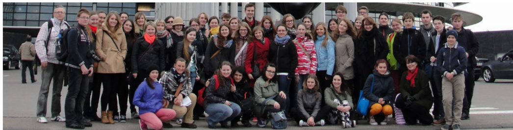
Francie, Štrasburk, Evropský parlament, reprezentace města Poděbrad, mírová mise krále Jiřího, 2014

550. výročí mírových misí Jiřího z Poděbrad a 10. výročí vstupu do EU Kolonáda, Poděbrady, 17. 5. 2014