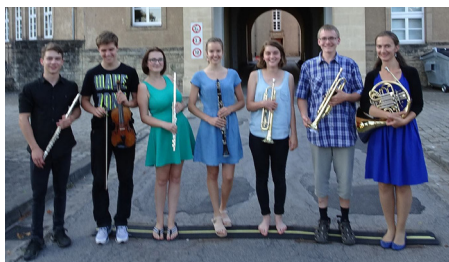
Lucembusko projekt EU Erasmus plus 2016