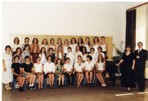
Dívčí sbor, 2000