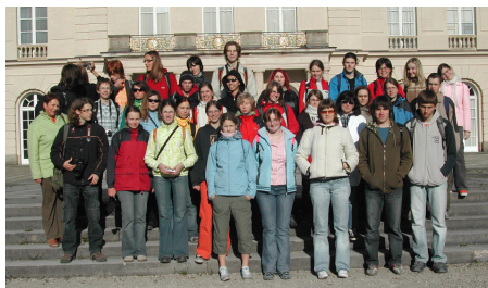
SRN, Bavorsko, ostrovní zámek Herrenchiemsee, spolupráce s pěveckým sborem z Mnichova, 2007