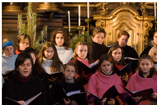
Loučeň, zámecká kaple, Rybova Česká mše vánoční "Hej, místě!", 2008