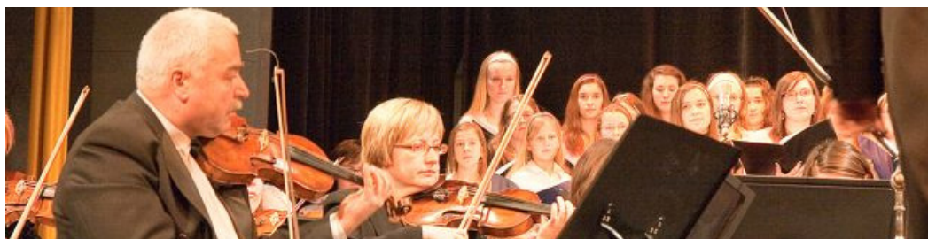
Poděbrady, divadlo Na Kovárně, koncert se Středočeským symfonickým orchestrem, 2009

Vánoční koncert (Společnost Otakara Vondrovice) Rybova Česká mše vánoční „Hej, mistře“ Chrám Povýšení sv. Kříže, Poděbrady, 18. prosince 2009