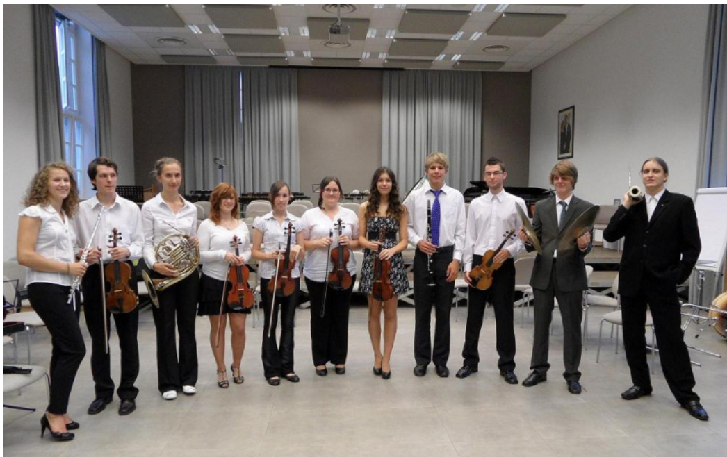
Lucembursko Ettelbruck, 2011