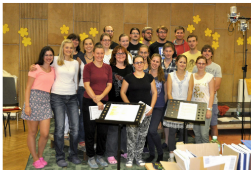
Collegium 2010, Natáčení CD Láska Notovaná, 2015