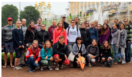
Rusko, Petrohrad, Carská rezidence Peterhof, koncertní cesta do Pobaltí a Ruska, spolupráce s konzulátem ČR v Petrohradě a pěveckým sborem v Petrohradě, 2016