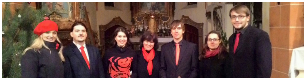
Mcely, kostel sv. Václava, benefiční koncert KviMtetu, 2015