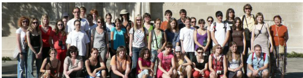
Švýcarsko, Ženeva, koncertní cesta ve spolupráci se Spolekem českých krajanů ve Švýcarsku, 2008

Koncert pro spoluobčany Diakonie ČCE, Libice nad Cidlinou, 19. září 2008