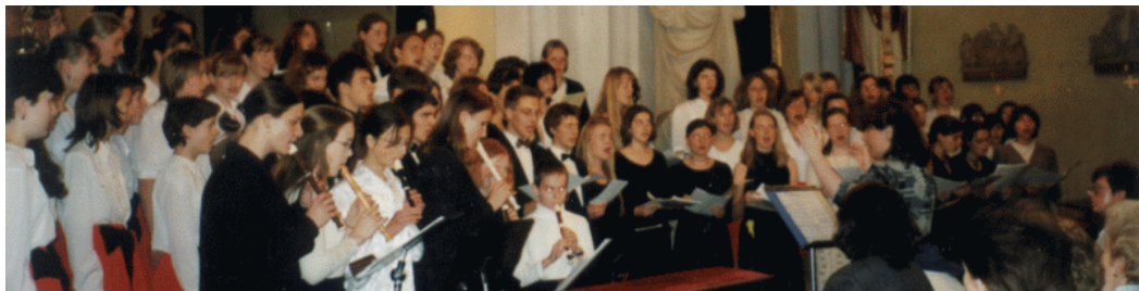
Nymburk, evangelický kostel, benefiční koncert pro děti z Dětského domova v Nymburce, 1999