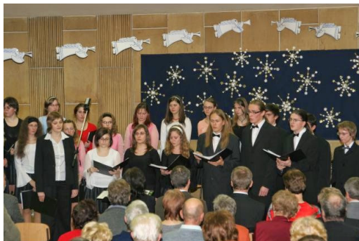
Poděbrady, DDM Symfonie, koncert k 15. výročí založení Pěveckého sboru GJP, 2007