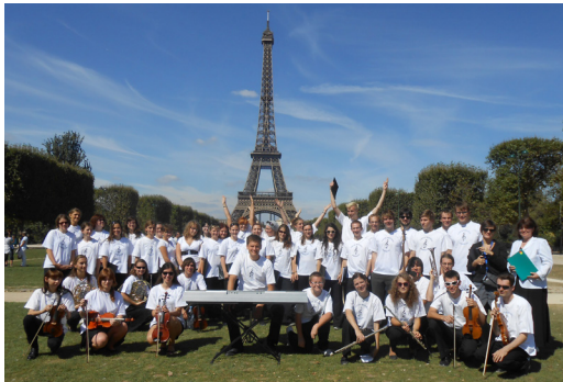
Mezinárodní festival pěveckých sborů, 2012