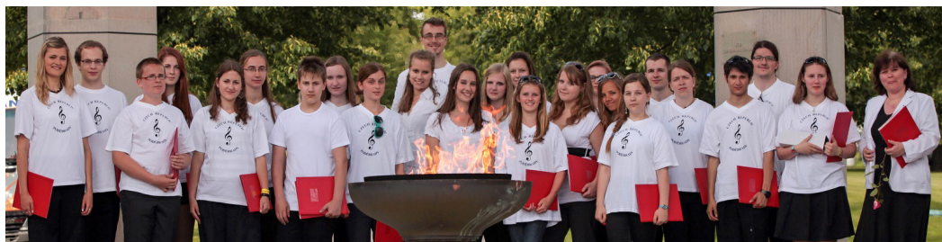
Celostátní přehlídka pěveckých sborů „Světlo za Lidice“, Památník Lidice, 2013

Kostel Českobratrské církve evangelické, Poděbrady, 27. 6. 2013