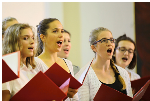
Rusko, Petrohrad, koncert v kostele sv. Petra, 2016