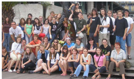
Švýcarsko, Montreaux, koncertní cesta ve spolupráci se spolkem českých krajanů, 2008