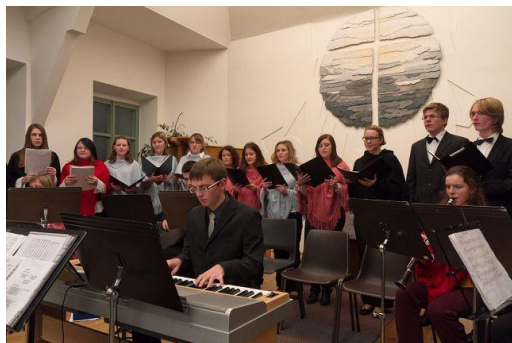
Poděbrady, kostel Československé církve evangelické, benefiční koncert pro Diakonii, 2009

latinsko-česká koleda z Jistebnického kancionálu