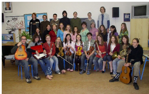
Smišžený sbor, 2007