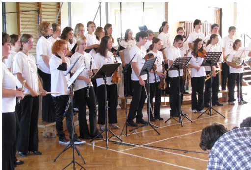
Městeck Králové, základní škola, interaktivní koncert pro žáky a se žáky ZŠ, 2008

moravská lidová píseň, arr. Květa Strejcová