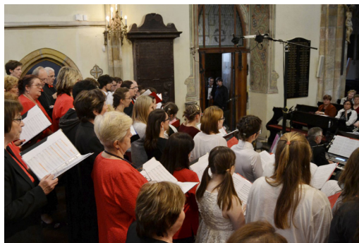
Nymburk, kostel sv. Jiljí, naše premiérové uvedení Requiem Wolfganga Amadea Mozarta, ve spolupráci s Hlaholem Nymburk, 2017