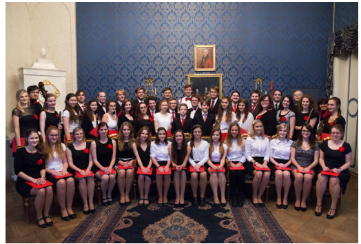
Pěvecký sbor, Orchestr GJP a Collegium 2010, 2016