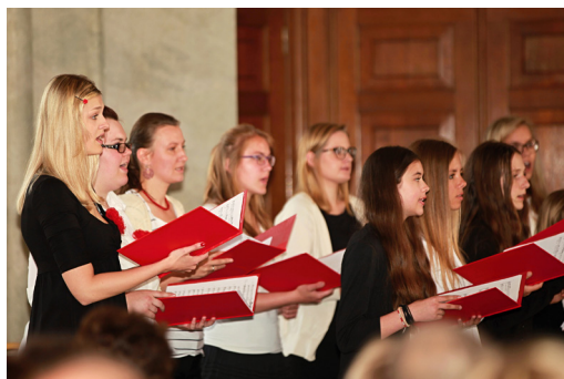
Chlumeck nad Cidlinou, zámek Karlova Koruna, benefiční koncert ve prospěch Zdravotního fondu Chlumeck nad Cidlinou, 2015

duchovní skladba, Giovanni Pierluigi da Palestrina