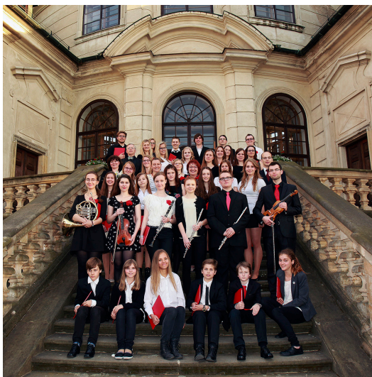
Zámek Karlova Koruna, benefiční koncert pro Zdravotní fond v Chlumci nad Cidlinou, 2014

V roce 2016 jsme přijali pozvání koncertovat v Opolanech, výtěžek byl určen Nadaci Haima podporující děti z hematologického a onkologického oddělení Fakultní nemocnice Motol .