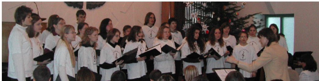
Poděbrady, kostel Československé církve evangelické, benefiční koncert pro Diakonii, 2005

Mezinárodní hudební projekt pro mladé hudebníky ze zemí EU, 3 koncerty pro veřejnost Ettelbrück, Lucembursko, 20. - 30. července 2005