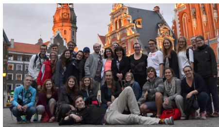
Pobaltí, Litva, Riga, koncertní cesta do Pobaltí a Ruska, 2016