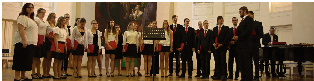
Rusko, Petrohrad, kostel sv. Petra, 2016