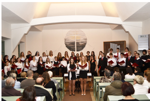
Poděbrady, kostel Českobratrské církve evangelické, benefiční koncert pro Gloriet, 2016